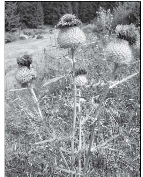
Pcháč bělohavý (Cirsium eriophorum) , lidově zvaný „valašská růže“, často rostoucí na pastvinách.

k výrazné změně v hospodaření. Valašsko tehdy bylo vybráno jako hlavně pastvinářsko-lukařská oblast, která byla stejně jako ostatní oblasti nucena do co nejvyšších zemědělských výkonů. Vládu nad zemědělskou produkcí převzala Jednotná zemědělská družstva. Došlo k zcelování pozemků a značně se rozšířila pastva hovězího dobytka. Komplex pastvin nebyl dostatečně úživný pro mnohoseťlavá stáda dobytka. Docházelo proto k zvýšenému hnojení chudých jalovcových pasínek, což mělo za následek jejich znehodnocení z hlediska kvality biodiverzity. Na pastvinách se naráz pohybovalo obrovské množství zvířat, které je svou činností dále devastovalo. Výrazně se omezilo drobné hospodaření, které bylo dříve zárukou tradiční a vyvážené péče o pozemky v soukromém vlastnictví. Lidé byli po generaci vázani ke svým pozemkům, o které se také velmi pečlivě starali. Vždyť na nich záviselo jejich žití! Kolektivizace tak způsobila vytržení těchto obyvatel z jejich přirozeného prostředí, ale hlavně zničila mnoha generacemi předávané rodinné stříbro – děděné pozemky. Došlo k vykořenění lidí z jejich prostoru.