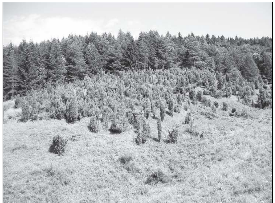
Pohled na zarůstající bývalou jalovcovou pastvinu v údolí Halenkov – Hluboké. Jalovcové keře zde již dosahují značného stáří, před několika lety došlo k odstranění vzrostlého stromového náletu.

Proč ale masivní vymírání modráška vůbec proběhlo? Co je jeho příčinou? Zde se konečně dostáváme k odpovědi na otázku, kterou jsme si položili na začátku tohoto povídání. Co má tedy společného ovce a modrásek černoskvrný? Modrásek černoskvrný je druh motýla, který má velmi specifické životní nároky. V červnu a na začátku července klade samička po oplození vajíčka jednotlivě na květy své živné rostliny – mateřidoušky vejčité. Housenka se jimi po vylíhnutí živí jen několik málo týdnů. Ještě v létě se spouští na zem, kde vstupuje do další velmi náročné etapy svého života. Čeká zde a svým pachem ze speciálních žláz láká dělnice mravence rodu Myrmica (červení žahaví mravenci). Dříve se tvrdilo, že jako adoptivní rodič může sloužit pouze jediný druh mravence – Myrmica sabuleti . Dnes se již ví, že je housenka schopna úspěšného vývoje i u jiných druhů. Dělnice ji poté opatrně uchopí a přenesou do mraveniště. Housenka se ale za tuto službu mravencům nehezky odvděčí. V mraveništi totiž požívá nejen ochrany před predátory, ale i