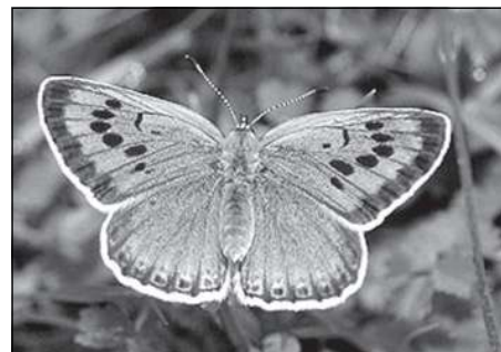
Modrásek černoskvrný ( Maculinea arion ). Odpovídající samec. Housenky jsou bytostně závislé na lokalitě s hojným výskytem svého hostitelského mravence rodu Myrmica .