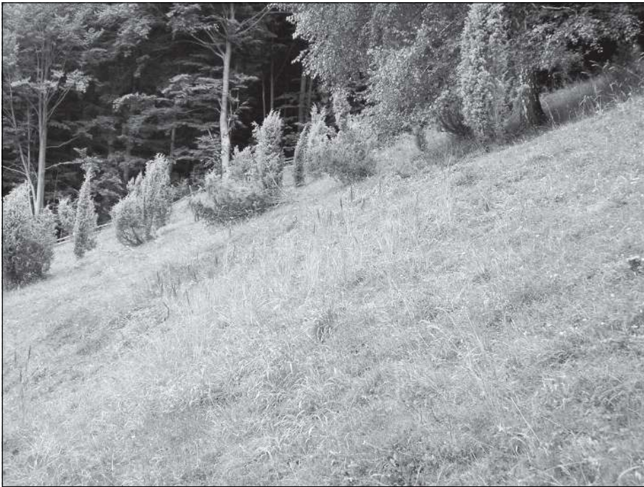
Extenzivně pasená louka v obci Halenkov. Pastviny, velmi bohaté na koncentrované porosty mateřídoušky a dalších pastevních rostlin, jsou velmi vhodné pro úspěšný vývoj modráška černoskvrnného.

larvy a kukly mravenců! Velmi tak mraveništi škodí. V případě, že bylo do mraveniště doneseno několik housenek naráz, mohou ty i samotné mraveništi zahubit! Na jaře příštího roku aktivuje po zimním spánku, dokrmí se (jak jinak než na larvách) a zakuklí. Motýl se záhy poté líhne a rychle se snaží opustit mraveništi. Mravenci na něj již útočí, protože přeměnou v dospělce přišel o své voňavé žlázy a stal se tak pro dělnice atraktivní pouze jako kořist. Pro tuto příležitost je porostlý jemnými chloupky, které se snadno stírají. Útočícím dělnicím zanášejí kusadla, která si musí instinktivně ihned vyčistit. Motýl má tak čas k úspěšnému opuštění svého bývalého bydliště.