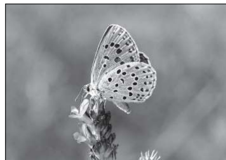
Modrásek černoskvrný ( Maculinea arion ). Vzácný druh vázaný na extenzivně pasené louky.

Mimo mravenčí kopečky najdeme i statnější rostliny. Z trav dominuje nenápadný a graciální psineček tenký ( Agrostis capillaris ) nebo do deseti centimetrů vysoké trsy tvořící kostřava červená ( Festuca rubra ). Tolik charakteristickou vůni čerstvě posečené trávy dodávají kumariny, které jsou obsaženy v další hojně trávě tomce vonné ( Anthoxanthum odoratum ), ostatně napoví nám to i její jméno. Z ostatních druhů, které na jalovcové pastvině najdeme, je to pampelišce podobná máchelka srstnatá ( Leontodon hispidus ), která kvete hojně na konci léta. Lidově se jí říká „kozí brada“. Již z dálky je nápadný pcháč bělohlavý ( Cirsium eriophorum ), statná ostnitá bylina, které se lidově říká „valašská růže“ a je často námětem pro lidové umělce. Jedovatý prýšec chvojka ( Tithymalus cyparissias ) tvoří na pastvinách celá kola, dobytek ho nespásá, a tak se může nerušeně rozrůstat. Vázán na tento druh je vzácný lišaj pryšcový ( Hyles euphorbiae ). Znamé jsou i pichlavé růžice pupavy bezlodyžné ( Carlina acaulis ), které se často suší a používají jako dekorace do suchých vazeb. Kořen pupavy bezlodyžné je silně aromatický a hořký. Od dávných dob byl používán jako léčivo a prodáván v lékárnách pod názvem „râkosový kořen“ nebo „kořen divokého artyčoku“. Jalovcové pastviny jsou druhově nepestřejší, ale také nejvíce ohroženy zarůstáním dřevin a kapradinou hasivkou orličí ( Pteridium aquilinum ).