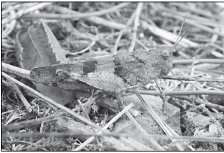
Saranče vrzavá ( Psophus stridulus ). Druh indikující zachovalé extenzivně pasené louky. Při jejím hlasitém letu jsou jasně patrná její červená křídla. Často provází svým rozšířením modráška černoskvrného.