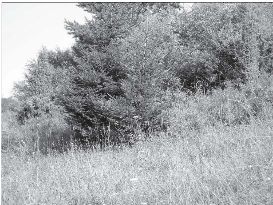
Pohled na asi 15 let neudržovanou bývalou pastvinu v Huslenkách – Bratřejůvce. Tato lokalita hostí stále původní pastevní druhy rostlin a živočichů. Jejich populace jsou však již velmi malé a vymírající.

Vzácné se na jižních svazích v nižších a středních polohách Vsetínských vrchů a Javorníků, zejména tam, kde podloží tvoří pískovce s vápnitým tmelem, vytvořily druhově bohaté porosty s řadou teplomilných druhů. Zde celé porosty širších listů vytváří statné trávy válečka prapořitá ( Brachypodium pinnatum ) a sveřep vzpřímený ( Bromus erectus ). Společně zde rostou druhy, které jinak najdeme mnohem jižněji nebo na mnohem vápnitějším podkladu. Je to smetanově nebo fialově kvetoucí teplomilný černoohlávek dřipatý ( Prunella laciniata ) nebo pcháč bezlodyžný ( Cirsium acaule ), který je v rámci České republiky nejhojnější právě na Vsetínsku. Vzácně se vyskytují i další teplomilné druhy jako žlutokvětý oman mečolistý ( Inula ensifolia ) a nádherný hořec křížatý ( Gentiana cruciata ) s tmavě modrými květy.