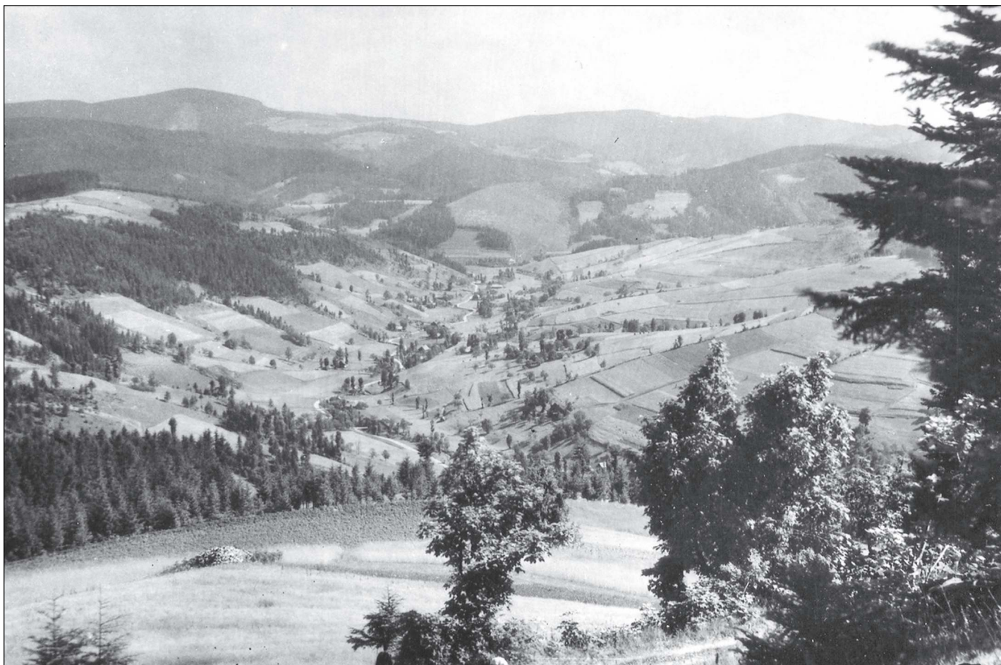
Pohled na údolí Velké Karlovice – Tisnávy. Historická fotografie pocházející z třicátých let minulého století. Patrná jsou četná mezemi dělená pole a loučky a solitérní stromy.