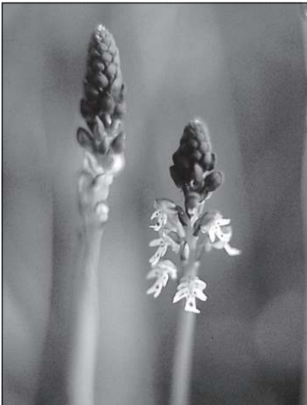
Vstavač osmahlý ( Orchis ustulata ). Vzácný druh orchideje, velmi zranitelný zanedbáním péče o lokality svého výskytu.

s bledě fialovými květy, mateřidoušku vejčitou ( Thymus pulegioides ) a drobný modrokvětvý vítod obecný ( Polygala vulgaris ) . Na těchto pastvinách najdeme i vřes ( Calluna vulgaris ) nebo borůvku ( Vaccinium myrtillus ) .