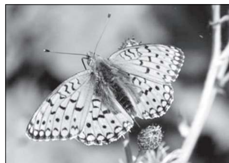
Perleťovec maceškový ( Argynnis niobe ). V rámci České republiky velmi vzácný a sporadicky se vyskytující motýl. Na Valašsku dosud místy hojnější.