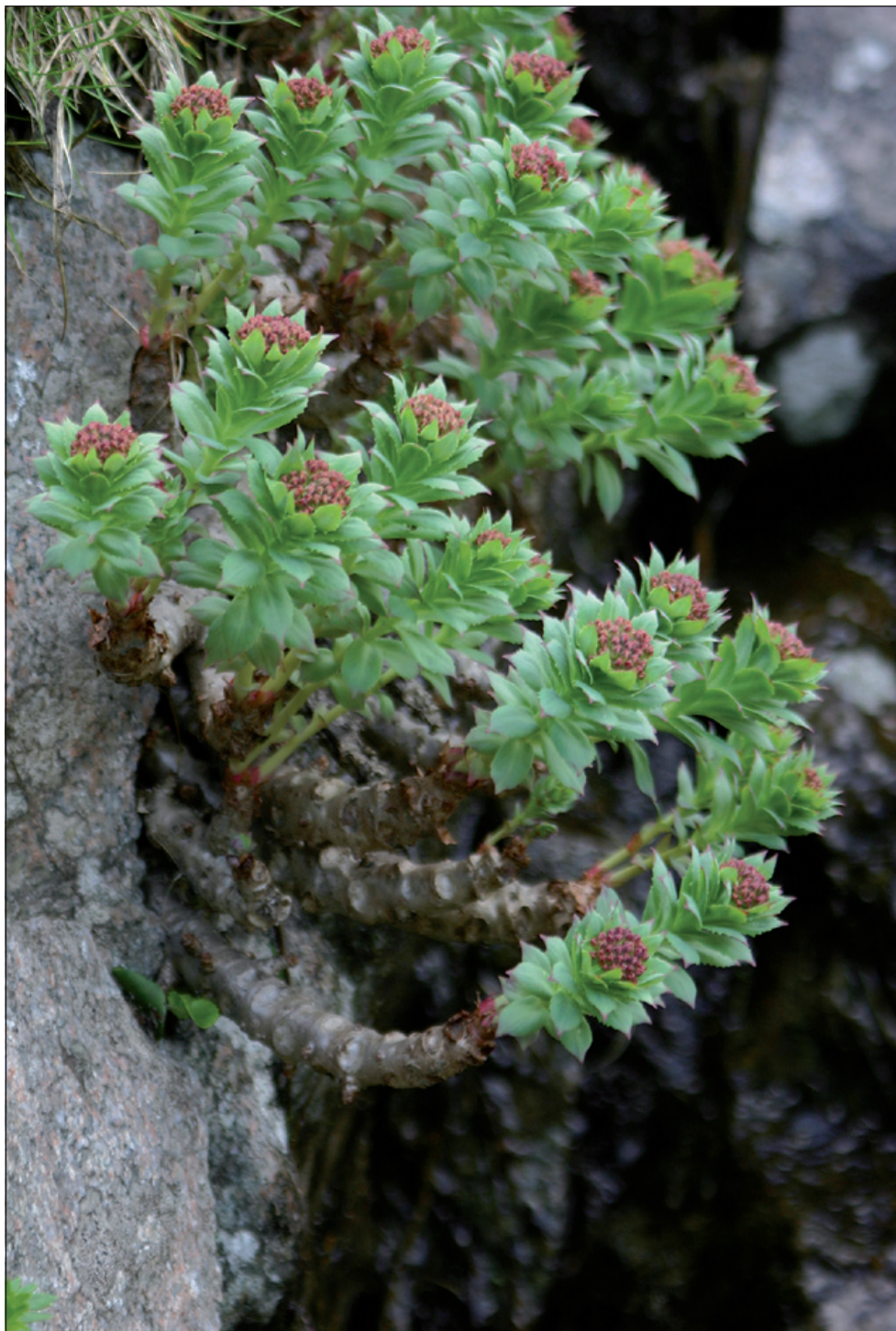
Obr. 1: Rhodiola rosea . Nízke Tatry, Bôr.