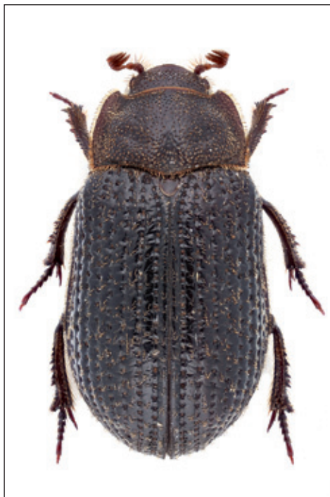
Obr. 1: Trox (Niditrox) perrisii Fairmaire, 1868 z Havraníků v Národním parku Podyjí; délka těla 6,4 mm. Fig. 1: Trox (Niditrox) perrisii Fairmaire, 1868 from Havraníky in Podyjí National Park; body length 6.4 mm.

Javorníky Mts., Huslenky env., PR Makyta (6774), 735 m n. m., 8. VI. 2018, 2 ex., na světlo společně s Trox (N.) scaber ve staré bučině, O. Konvička leg., det. et coll.