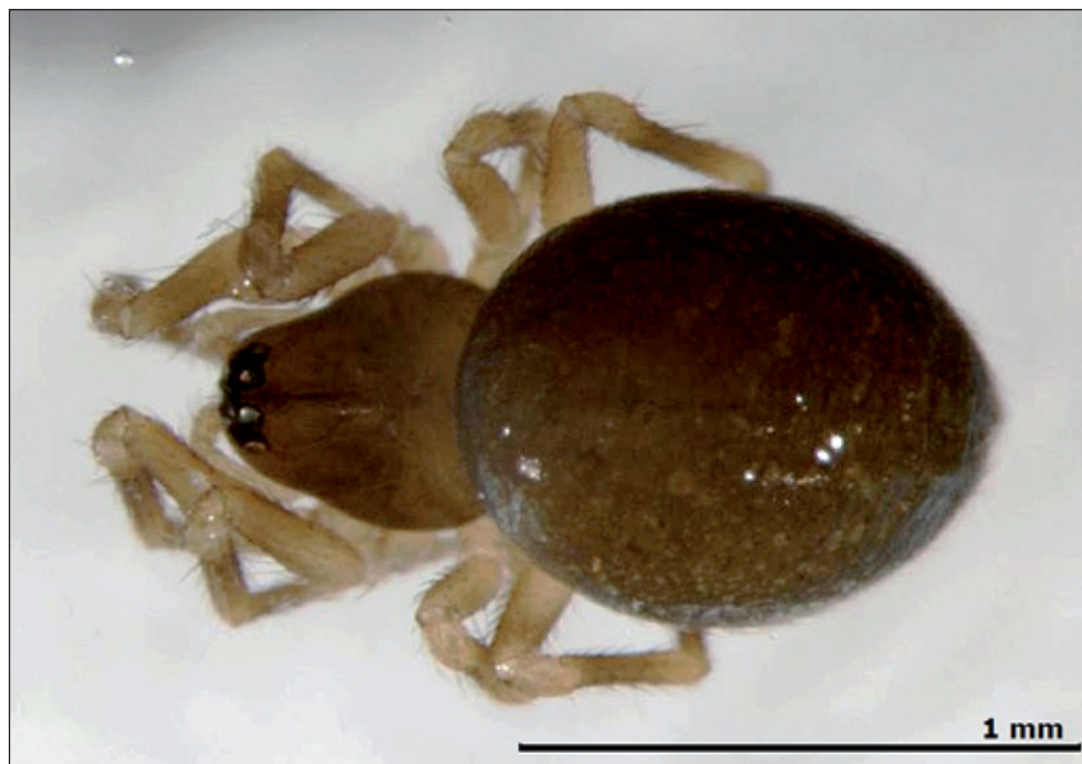
Obr. 1: Samice C. gradata z lokality Lhotské Paseky.

Fig. 1: Female of C. gradata from the locality Lhotské Paseky.