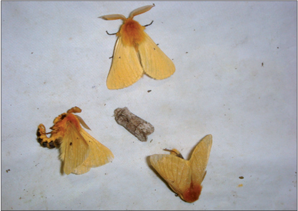
Obr. 1: Tři samci pabourovce pampeliškového na lokalitě Valašská Polanka (pole síťového mapování 6773), 28. VIII. 2017 (okr. Vsetín) spolu s typickým doprovodným druhem bourovcem hlohovým ( Trichiura crataegi Linnaeus, 1758). Jeden samec pabourovce vlevo v „obránné pozici“.

sem veřejných či soukromých sbírek a nepublikovaných dat mapovatelů motýlů shrnutých v databázích Mapování motýlů ČR (spravovaná Entomologickým ústavem BC AV ČR) a Nálezové databázi ochrany přírody – NDOP