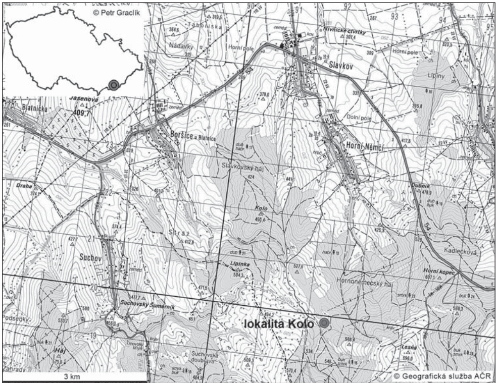
Obr. 1: Geografická poloha studované lokality.