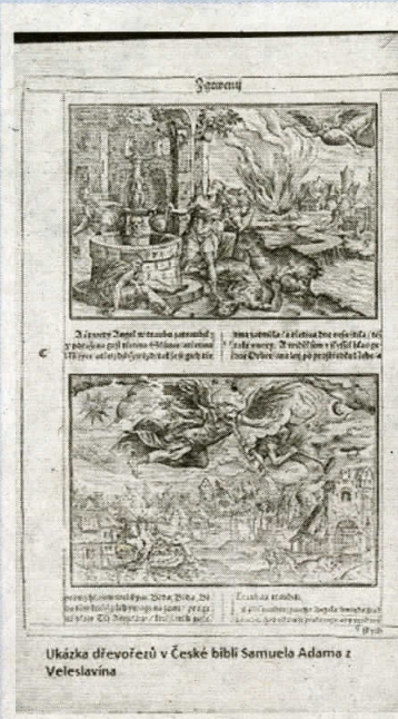
Ukázka dřevořezů v České biblí Samuela Adama z Veleslavína

Muzeum ve Valašském Meziříčí vlastní dva exempláře kralické jednodílnky z r. 1613 i Českou biblí Samuela Adama z Veleslavína. S jejich podrobnějšími osudy se můžete seznámit v muzejní expozici Staré tisky vpravdě, kterou najdete v zámku