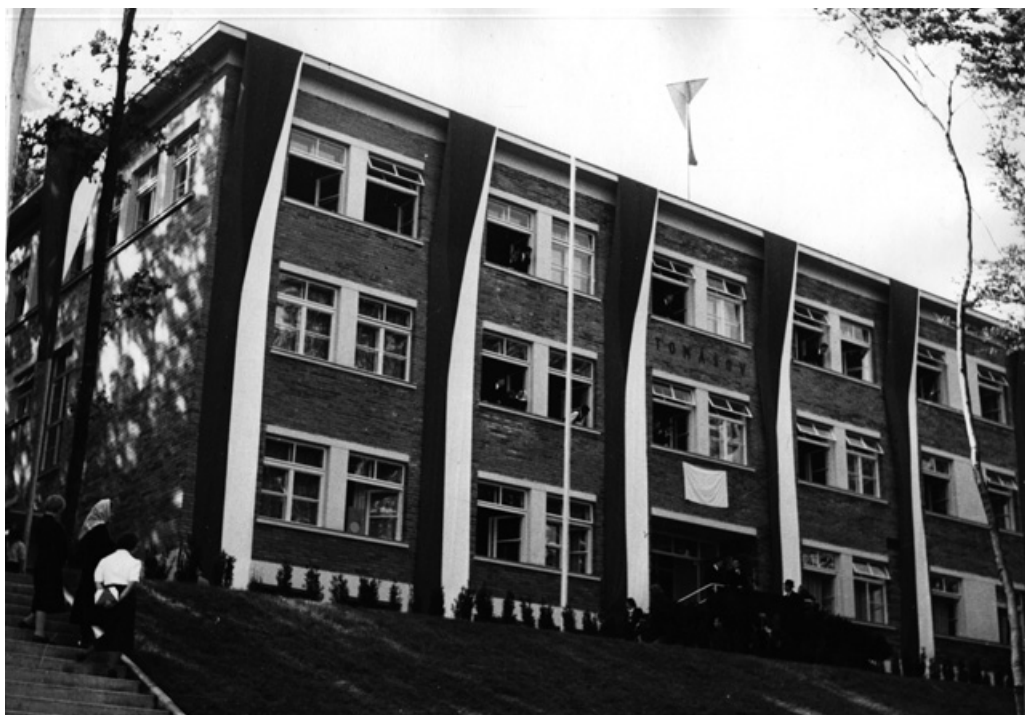
Tomášov při slavnostním otevření 28. srpna 1938. Fotoarchiv MJVM. |