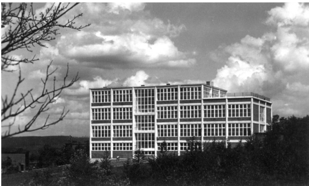
Obecná škola Palackého na Letné, 1937.

Specifickou institucí v rámci baťovského vzdělávacího systému se měl stát Tomášov, zaměřený na výchovu budoucích vedoucích pracovníků firmy. Jeho absolventi měli být nejen odborníky ve výrobní sféře, ale zároveň důstojnými reprezentanty firmy. Měli studovat cizí jazyky, literaturu, společenskou výchovu, nauku o veřejné