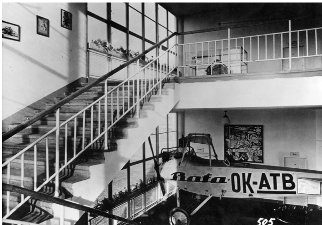
Studijní ústav, schodiště s letadlem firmy Baťa, 1937.

K velkému významu, který firma Baťa přikládala jazykovým znalostem, se váže i dobová skoroanekdota: „Nedávno šel od Baťova památníku ve Zlíně cizinec. Rozhlížel se pátravě a ptal se: „Hotel, hotel?“ Potkal ho dvanáctiletý Zlíňan a zeptal se ho německy: „Hledáte hotel?“ Cizinec odpověděl anglicky: „Nerozumím, nerozumím, mluvím anglicky. Kde je tady hotel?“ A mladý Zlíňan spustil anglicky: „Ach tak, vy jste Angličan! Prosím, zavedu vás do hotelu.“ Cizinec byl tak mile překvapen, že vyzvedl hochu do výše a div ho nezlíbal. Město Zlín oceňuje význam znalosti cizích jazyků. Proto zřídilo cizojazyčnou školu, kde jsou oddělení německé, anglické a francouzské s učiteli rodilými Němci, Angličany a Francouzi. Žáci těchto škol – 11–14 letí chlapci a děvčata – umějí vedle mateřské češtiny ještě jeden nebo dva cizí jazyky.“ (Duch času Moravská Ostrava, 16. 10. 1935)