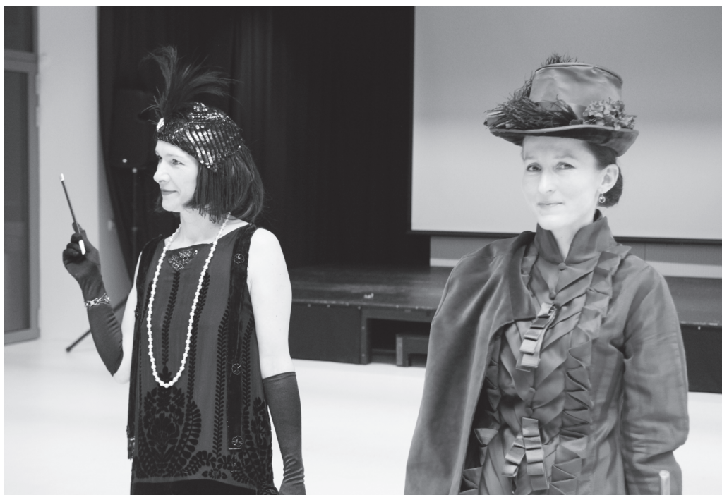
Společenský večer s historickou módní přehlídkou Luhačovického okrašlovacího spolku Calma. | Foto R. Ševčík, fotoarchiv MJVM. |