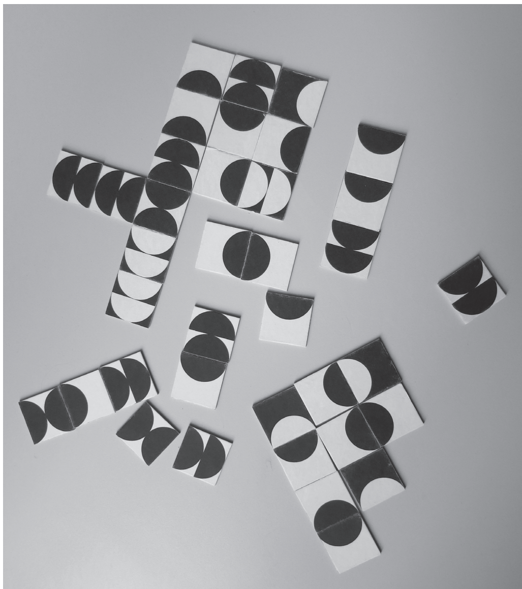
Prototypy edukačních pomůcek navržených studenty muzejní a galerijní pedagogiky.

a realizaci funkční textové didaktické pomůcky, která má v muzejní edukaci již své pevné místo. Jde o pracovní listy, jejichž příprava je v rámci disciplíny pojmána v celém komplexu činností: od výběru vhodného tématu, přes didaktickou transformaci učiva až po návrh grafického řešení a jeho realizaci ve vhodném grafickém programu. Studenti vytvoří koncepci, strukturu a grafický návrh animačních pracovních listů, tak aby podporovaly proces učení v muzeu. Důraz bude kladen na schopnost vyjádření daného tématu grafickými prostředky se zřetelem na interaktivitu a schopnost přenosu informací. Realizace návrhů proběhne pomocí příslušného grafického SW (Adobe Photoshop, Adobe InDesign, Corel Draw).