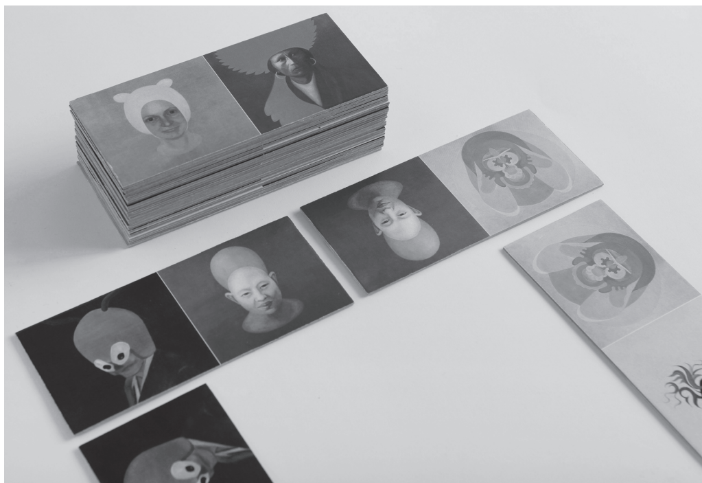
Prototypy edukačních pomůcek navržených studenty muzejní a galerijní pedagogiky.

Exkurze proměny muzejní prezentace uzavírá modul povinných muzejně pedagogických disciplín a představuje podoby současných muzejních a galerijních prezentací u nás i ve světě, a to jak po stránce kurátorské, tak i vzhledem k prostorovému řešení expozice. Zvláště se zaměřuje na architektonické řešení muzeí a galerií a ukazuje úspěšné příklady inovativního přístupu k muzejním expozicím. Diskutovány jsou zde současné trendy v muzejních expozicích, mezi něž patří využití digitálních technologií, moderní techniky a interaktivních exponátů, resp. modelů. V souvislosti s prezentacemi umění se disciplína zaměřuje také na filozofickou reflexi přítomnosti s cílem pochopit obecné souvislosti uměleckých projevů s aktuálními jevy a procesy společnosti, a to především v oblasti výtvarného vyjadřování a vizuální komunikace. Studenti jsou vedeni k aktivnímu uchopení problému muzejní prezentace, ke