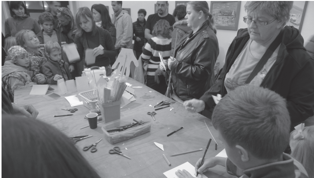
Komunitní projekt Den dýní v roce 2015. |

Praktikanti jsou k dispozici pouze v jarních měsících a ve většině případů není možné je nechat samostatně pracovat. Jsou pouze k ruce, a i když je to vítaná pomoc, hlavní část zůstává na mě.