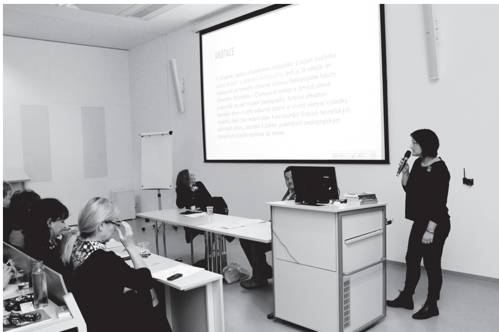
Konference Muzeum a škola.