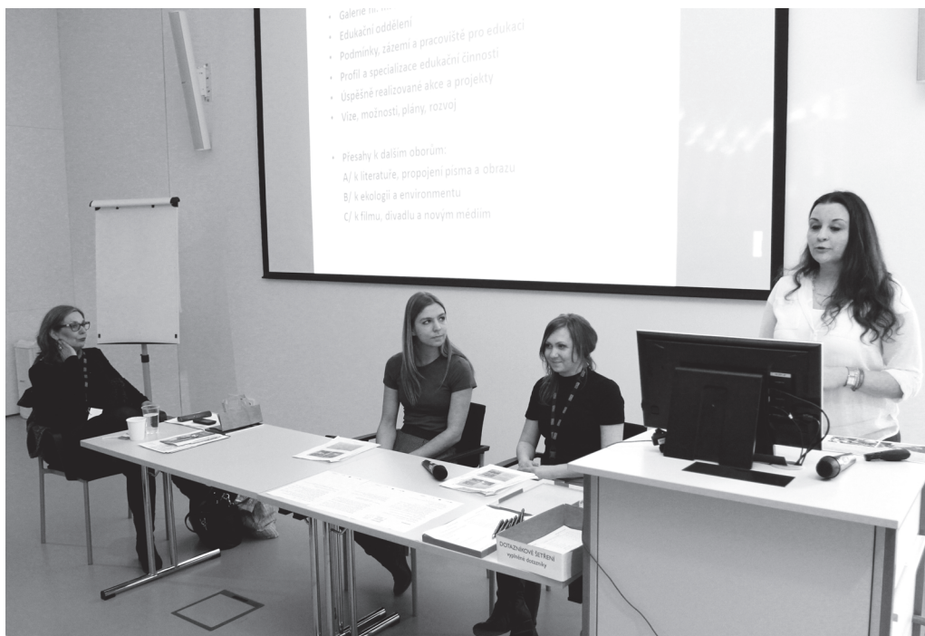
Konference Muzeum a škola. Fotoarchiv MJVM. |