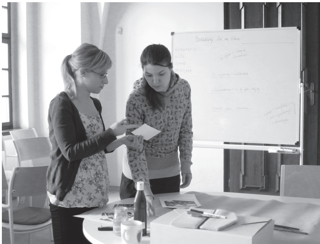
Studentky muzejní a galerijní pedagogiky.

Obor je koncipován tak, aby kvalitně připravil budoucí muzejní a galerijní pedagogy s odbornou kvalifikací pro působení ve specifickém edukačním prostředí muzea a galerie, příp. jiné paměťové instituce. Profesní uplatnění našich absolventů je v oblasti sbírkotvorných, výstavních a obecně kulturních institucí, a to jak v rovině vzdělávání formálního (ve spolupráci muzeí se školami), tak i neformálního a informálního (neformální vzdělávací programy muzeí pro děti a mládež, tvorba a vedení edukačních programů pro různé návštěvnické skupiny, facilitace učebních procesů u neorganizovaných návštěvníků).