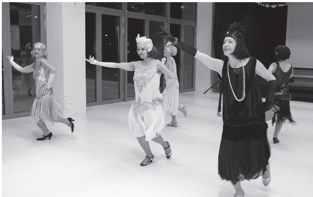
Společenský večer s historickou módní přehlídkou Luhačovického okrašlovacího spolku Calma. | Foto R. Ševčík, fotoarchiv MJVM. |