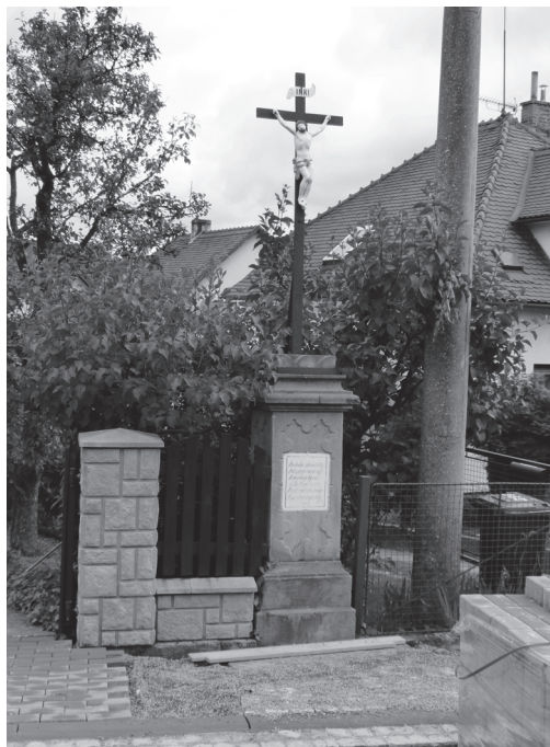
Obr. 1: Langův kříž z roku 1872 v Želechovicích. | Foto A. Naňák, 2014. |