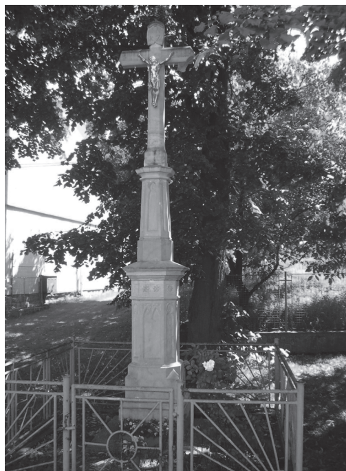
Obr. 13: Kříž J. Svobody z roku 1906 ve Študlově. | Foto A. Naňák, 2008.