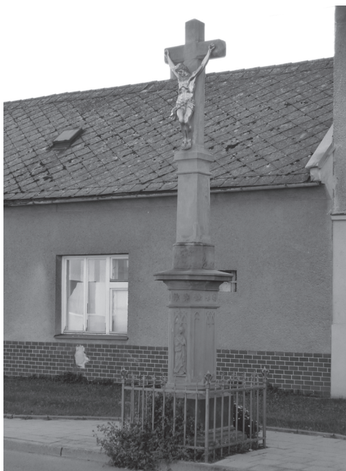
Obr. 10: Kříž ve Zlíně-Prštném z roku 1886.