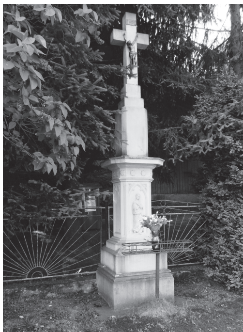
Obr. 3: Kříž ve Zlíně-Přiluku z roku 1881.