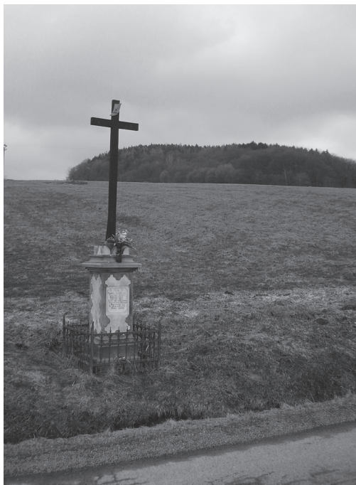
Obr. 2: Kříž z roku 1876 v Provodově. | Foto A. Naňák, 2013. |