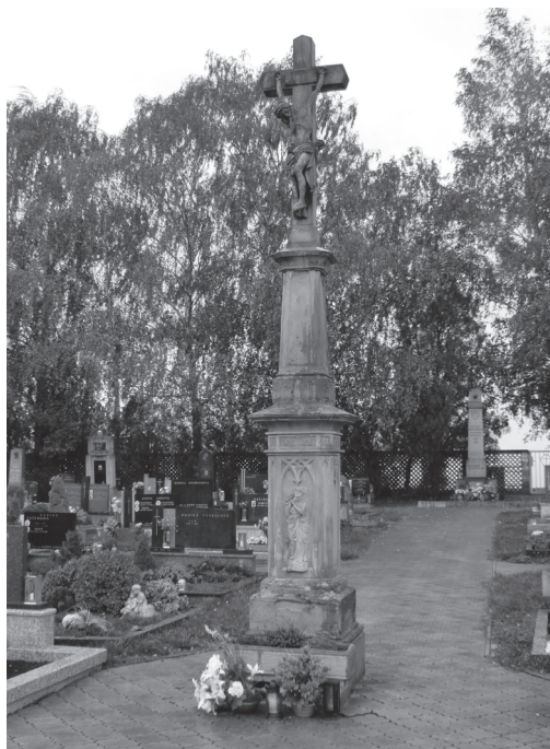
Obr. 12: Kříž na Hřbitově ve Lhotě u Zlína z roku 1902.