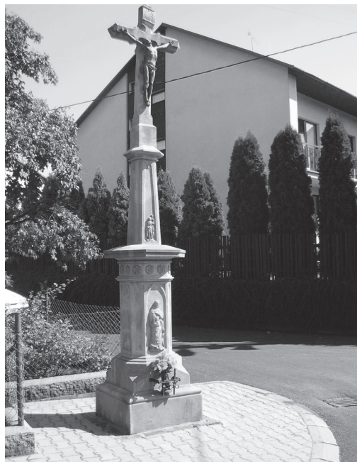
Obr. 6: Kříž z r. 1884 v Poteči.