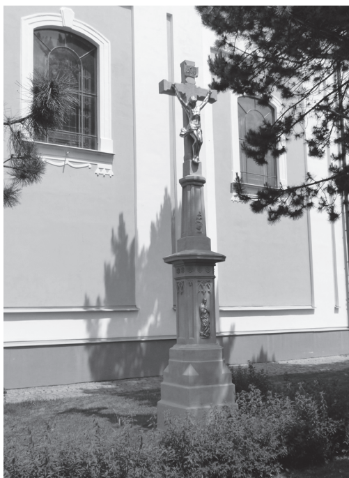
Obr. 4: Kříž z roku 1883 ve Slušovicích.