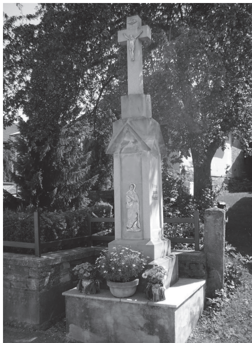
Obr. 7: Kříž z roku 1885 v Poteči.