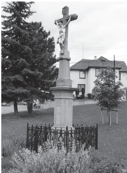
Obr. 8: Kříž z roku 1886 v Lužkovicích.