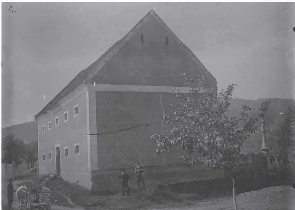
Obr. 11: Kontribučenská sýpka ve Zlíně v roce 1903. Napravo kříž z Langovy dílny. Zapůjčil MZA Brno, SOkA Zlín. |

Kamenické zakázky samozřejmě netvořily jen celokamenné kříže, podstavce pro kříže litinové či jiné zakázky více či méně výtvarného charakteru. Kameník byl oslovován i na práce prostší povahy – do jeho sortimentu tak patřily schodišťové stupně, prahy, ostění, mlecí kameny a mnoho dalšího. Samostatnou oblastí pak jsou náhrobní kameny a kříže a obecně funerální architektura. Ta tvořila významnou část kamenické práce, bohužel však právě ona podléhá „módním“ vlnám, mění se a zaniká. Prokazatelně Langovo dílo z této oblasti se doposud nalézt nepodařilo.