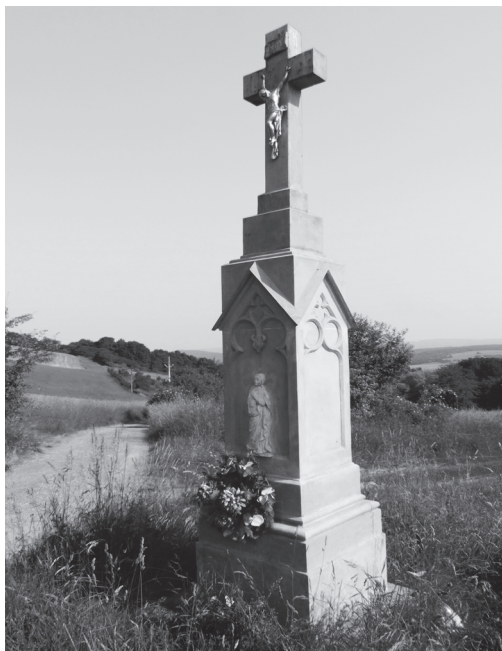
Obr. 5: Pivodův kříž z roku 1883 v Jaroslavicích. | Foto A. Naňák, 2015.

O rok později František Lang kříž s obdobnými tvaroslovnými prvky jako ve Slušovicích zhotovuje pro obec Poteč na Valašskokloboucku (obr. 6). Na jednom stupni,