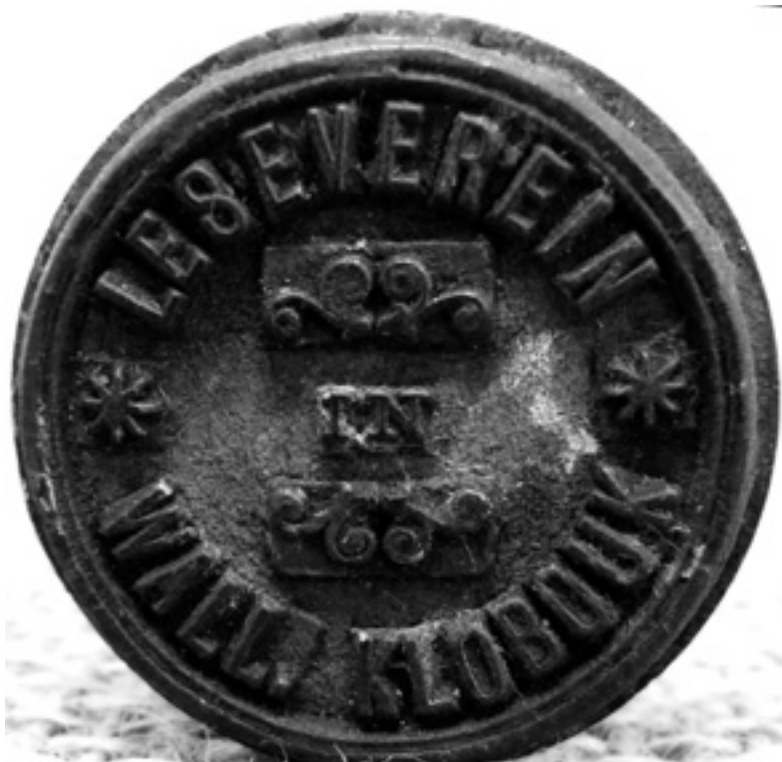
Razítko čtenářského spolku Casino (detail). | Městské muzeum Valašské Klobouky, Historická a etnografická sbírka, inv. č. 3875. |