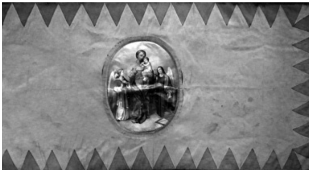
Spolkový prapor valašskokloboucké Omladiny (avers). | Městské muzeum Valašské Klobouky, Historická a etnografická sbírka, inv. č. 4025.

Po slavnosti naše věc trpěla poněkud, že se národní ruch štěpil dvěma proudy, Besedou Dobrovský a Omladinou, ale rozvíjela se celkem dobře i nadále. Omla-