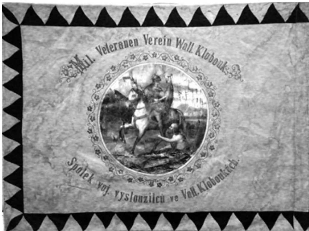
Spolek vojenských vysloužilců Valašské Klobouky, prapor (revers). Městské muzeum Valašské Klobouky, Historická a etnografická sbírka, inv. č. 4026.

Ve sbírkách Městského muzea Valašské Klobouky je uchováván symbol spolku, totiž spolkový prapor i se dvěma praporovými stuhami, ozdobně vyšívanými zlatou nití. 23 Prapor o rozměrech 180 × 135 cm je vyroben z rypsovaného hedvábí a bavlněného plátna. Na okrajích listů obou stran kromě okraje žerďového je kombinace žlutých a černých plamenných trojúhelníků. Aversní i reversní strana mají zlatou barvu (barvami císařství byly žlutá a černá). Na aversu praporu je skvostně vyšit rakouský malý státní znak (tříkrát korunovaný dvouhlavý orel se zlatou zbrojí). Ve středu reversu je umístěna aplikace: kruhová malba, zobrazující svatého Martina (na bílém koni) půlícího svůj plášť, aby polovinu mohl dát polooděnému žebrákovi. Kolem malby je vyšit vegetabilní ornament; nad malbou čteme nápis „Mil. Veteranen Verein Wall. Klobouk.“, pod malbou „Spolek voj. vysloužilců ve Vall. Kloboukách.“. Díky první