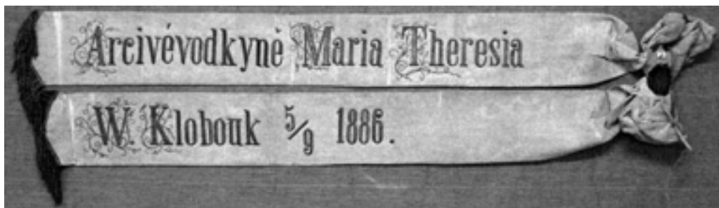
Spolek vojenských vysloužilců Valašské Klobouky, praporové stuhy. | Městské muzeum Valašské Klobouky, Historická a etnografická sbírka, inv. č. 4027.