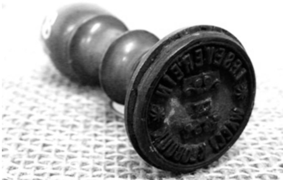
Razítko čtenářského spolku Casino. | Městské muzeum Valašské Klobouky, Historická a etnografická sbírka, inv. č. 3875. |