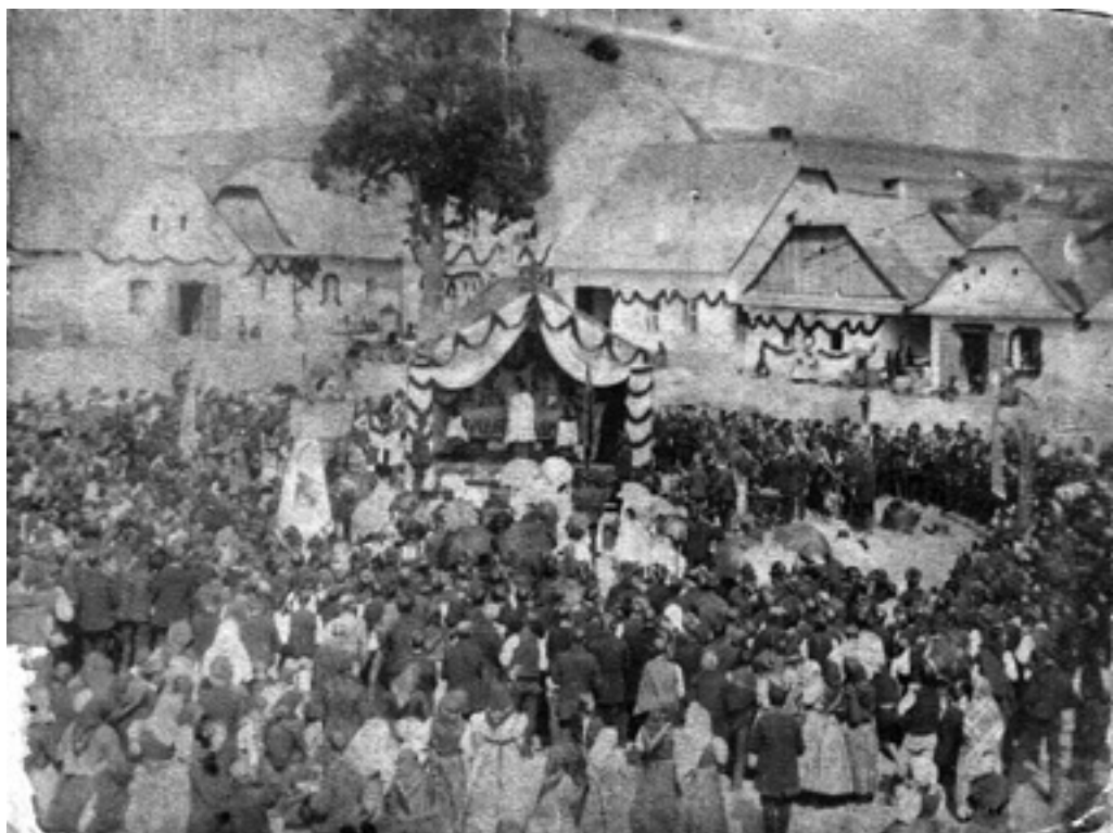
Svěcení praporu valašskoklobouckého spolku vojenských vysloužilců (I), 5. září 1886.