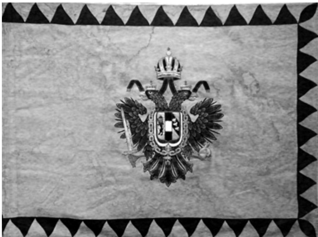
Spolek vojenských vysloužilců Valašské Klobouky, prapor (avers). Městské muzeum Valašské Klobouky, Historická a etnografická sbírka, inv. č. 4026.