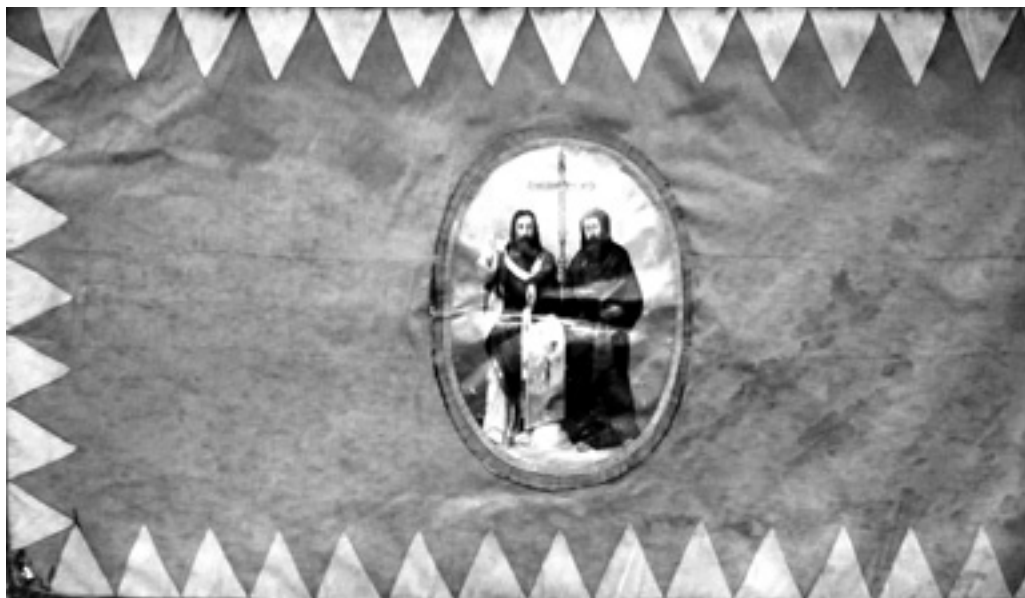
Spolkový prapor valaškokloboucké Omladiny (revers). Městské muzeum Valašské Klobouky, Historická a etnografická sbírka, inv. č. 4025.

Další doklady činnosti spolku již bohužel nejsou k dispozici. Omladina v Kloboukách fungovala do roku 1888 . 19