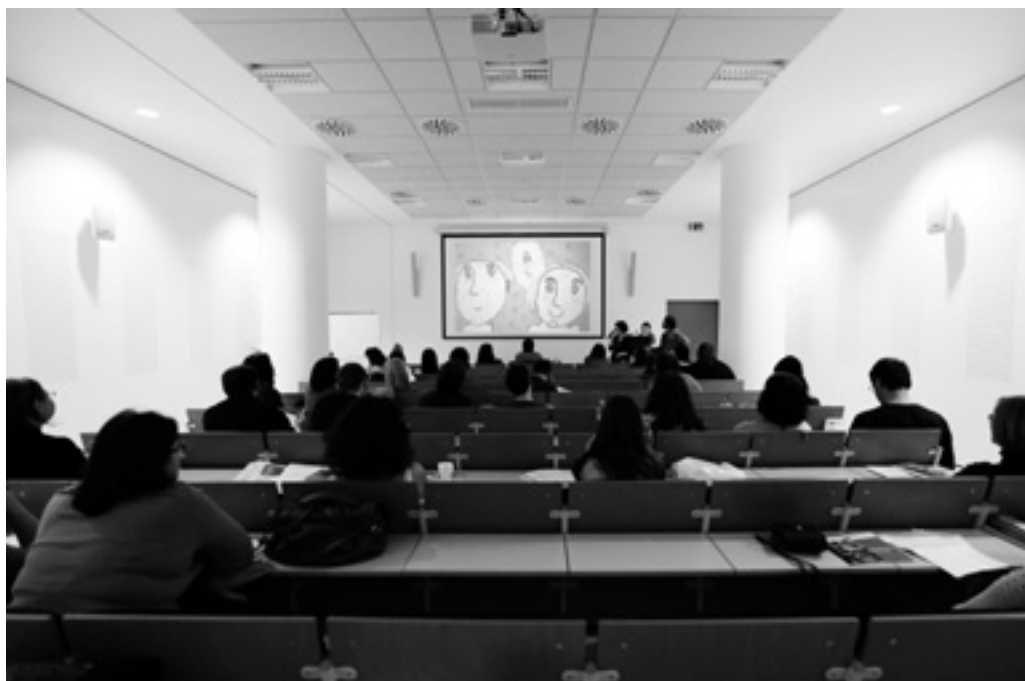
Prezentace prací vytvořených v dílnách animovaného filmu v kulturním centru Stanica Žilina-Záriečie.