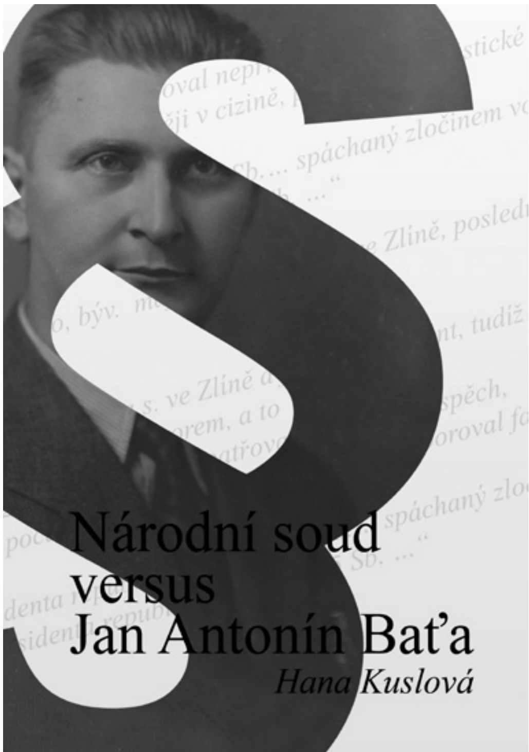
Obálka publikace Národní soud versus Jan Antonín Baťa . |