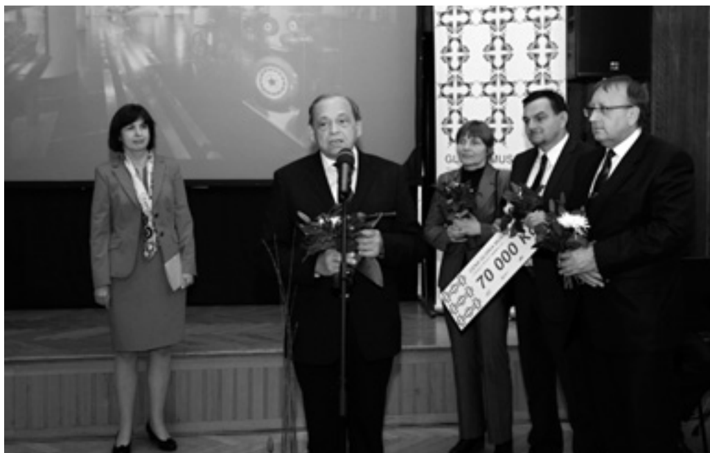
Převzetí ceny.

V třetím nadzemním podlaží bývalé tovární budovy 14 vznikl soubor dílčích expozic pod zastřešujícím názvem Princip Baťa: Dnes fantazie, zítra skutečnost . V expozici jsou začleněna tři velká témata: Obuv a produkce firmy Baťa, Film a Cestovatelství . Z dalších témat věnujících se baťovskému systému jsou čtyři postavena na trojrozměrných exponátech: Ševcovská dílna, Výroba, Prodejny, Doprava . Samostatný celek tvoří oddíl věnovaný historii firmy a osobnostem , které s ní byly spojeny (T. Baťa, J. A. Baťa, Baťovci). Ten spolu s úvodním filmem (multiprojekcí) prezentujícím růst a vývoj Zlína dominuje vstupu do expozice. Další dílčí celky jsou prezentovány prostřednictvím obrazových a textových materiálů a jsou soustředěny do tzv. klidové zóny. Ta je řešena ve stylu interiéru zlínského Společenského domu a návštěvníci zde najdou baťovské časopisy, publikace a materiály s rozšiřujícími informacemi.