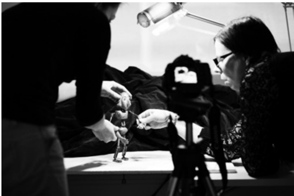
Účastnice Workshopu klasické filmové animace při práci na animaci loutky.

a Michaela Carringtona. Výstupem z workshopu bylo pět krátkých animovaných etud, dokládajících, že i méně zkušený tvůrce (návštěvník muzea, dítě či dospělý) je schopen pod vedením lektora během jediného dne vytvořit filmovou animaci, jejímž prostřednictvím získává nejen technické a umělecké dovednosti a znalosti, ale především se učí o vystavených objektech či historických souvislostech na základě vlastní zkušenosti a prožitku.