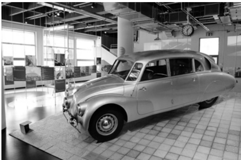
Tatra cestovatelů Hanzelky a Zikmunda.