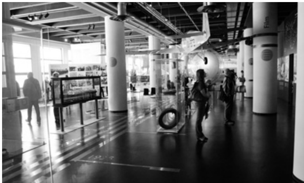
Pohled do historické části expozice. Fotoarchiv MJVM. |

II. cena v kategorii Muzejní počín byla zároveň udělena celému projektu moderního kulturního a vzdělávacího centra Zlínského kraje 14 | 15 BAŤŮV INSTITUT, v němž sídlí tři kulturní instituce – Muzeum jihovýchodní Moravy, Krajská galerie a Krajská knihovna Františka Bartoše.