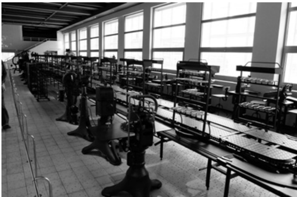
Obuvnická výrobní linka. Fotoarchiv MJVM. |