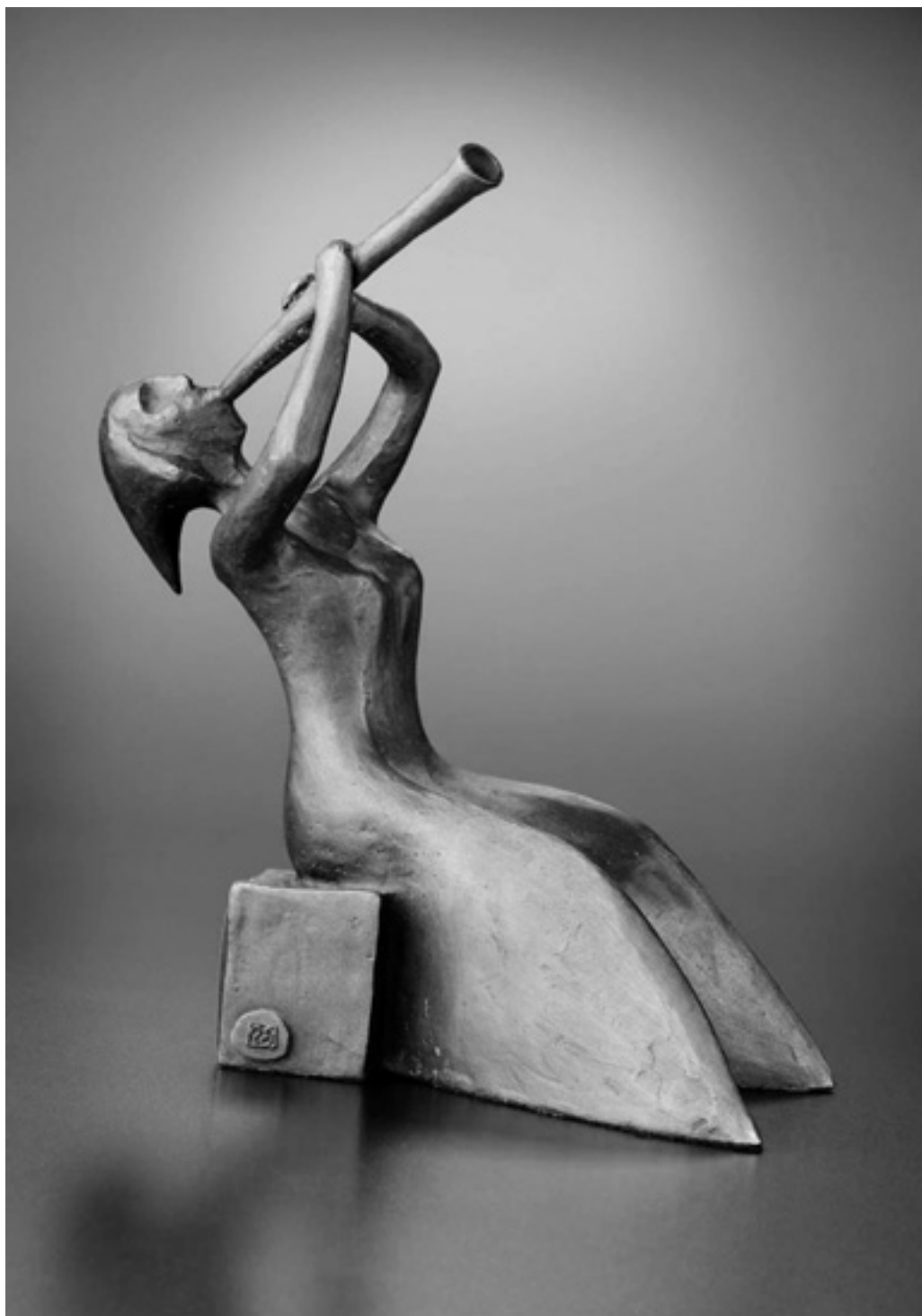
Cena Gloria musaealis. Foto – Ondrej Kocourek. |