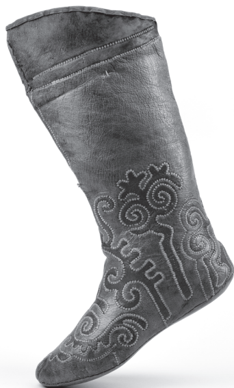
Taneční holínky z oblasti Krymu a Kavkazu. |