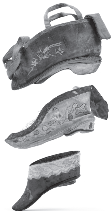
Střevíčky zvané zlaté lilie nebo lotosový květ. |