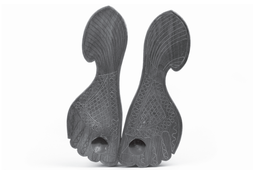
Mušské sandály typu paduka zvané khadaun. |

Česká verze katalogu je k dostání v objektu 14-15 BAŤŮV INSTITUT, konkrétně v budově 14, Vavrečkova 7040 ve Zlíně za 250 Kč. Vzhledem k ojedinělosti celé sbírky by bylo velmi užitečné připravit v dohledné době i jeho anglickou verzi.