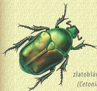
zlatohlávek zlatý ( Cetonia aurata )

V hniјících kmenech na zemi a ve štěpce žijí třeba larvy zlatohlávků nebo roháčů . Pod kůrou polen bydlí tesaříci, červotoči a mnoho dalších malých dřevních brouků. Hnízdo si zde mohou postavit čmeláci a mravenčí . Do osluněných kmenů se nastěhují i samotářské vosičky a včelky . I přes svůj název ale broukoviště neposkytuje úkryt pouze hmyzu. Zabydlet se v něm mohou i ještěrky, slepýši nebo si postaví hnízdo drobní pěvci . V zimě v něm zase přespí ježek.