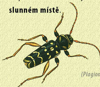
tesařík dubový ( Plagionotus arcuatus )

Naše broukoviště je hromada dřeva, kterou vidíte u zámecké zdi. Hmyz více než estetiku ocení příjemné bydlení! Maximum dřeva jsme ponechali s kůrou a strany hromady klád obsypali štěpkou. Broukoviště jsme umístili na slunném místě.