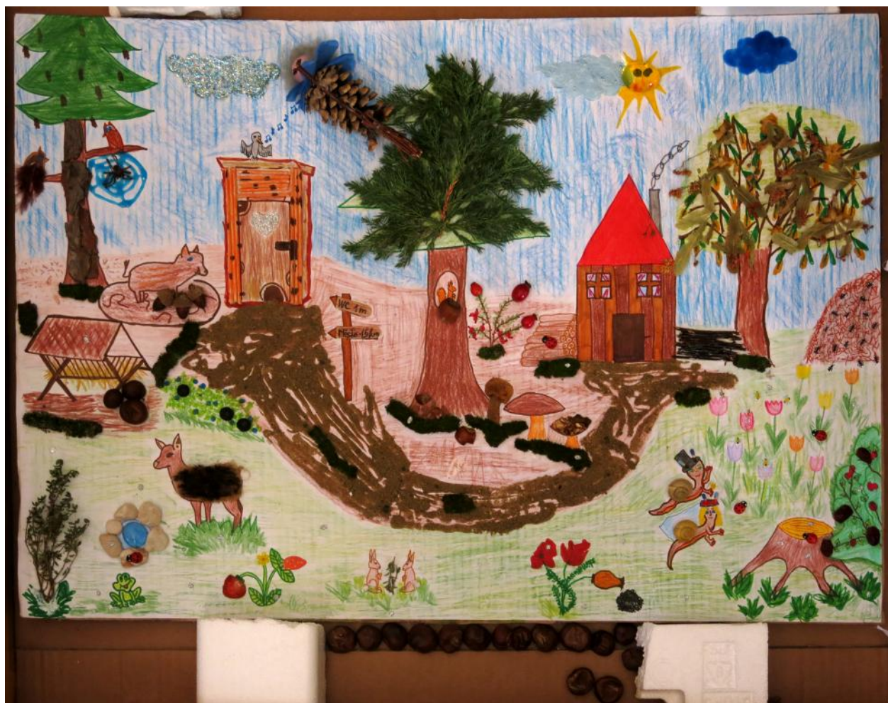
Vítězný obrázek dětí ze ZŠ Trávníky

Velké poděkování patří všem, kdo se na akci podíleli, pomáhali při ní a také ji podpořili. Za ceny děkujeme občanskému sdružení Líška a Muzeu regionu Valašsko, p.o. Děkujeme také paním učitelkám za pomoc při organizaci, za přípravu dětí na soutěž a samozřejmě také samotným soutěžícím za nadšení, s jakým se do soutěžního klání pustili.