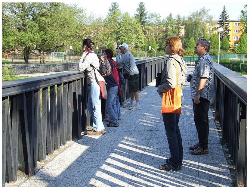
Ve Valašském Meziříčí na lávce přes Rožnovskou Bečvu pod Žerotínským zámkem.