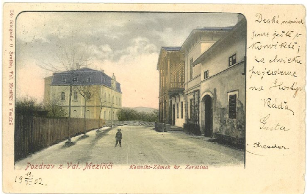
Obr. 9: Valašskomeziříčský manský zámek (vlevo), sídlo Jaromíra hraběte Bukůvky z Bukůvky, s protilehlým salvatoriánským konviktem na pohlednici z roku 1899.

Die fotografie O. Šrutka, Val. Meziříčí a Veselíně