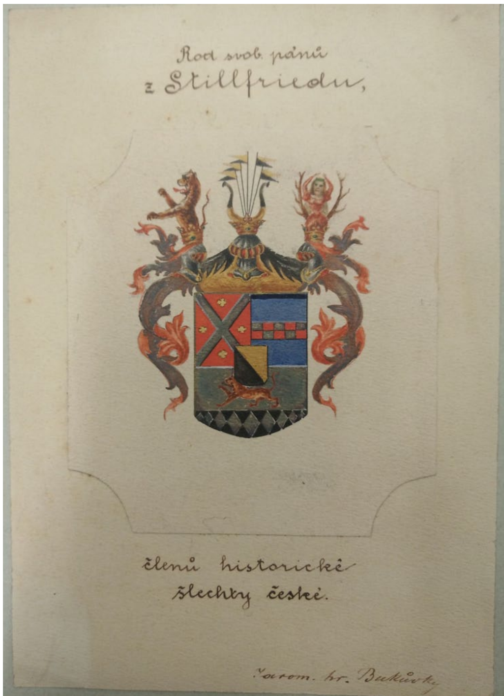
Obr. 11: Erb rodu Stillfriedů, který byl zhotoven Jaromírem hrabětem Bukůvkou z Bukůvky pro potřeby expozice valašskomeziříčského muzea mezi léty 1903–1904.