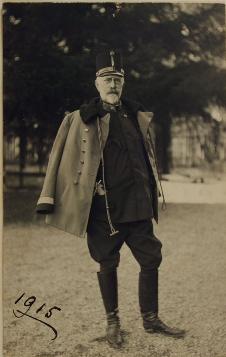
Obr. 2: Jaromír hrabě Bukůvka z Bukůvky ve vojenské uniformě na snímku z roku 1915