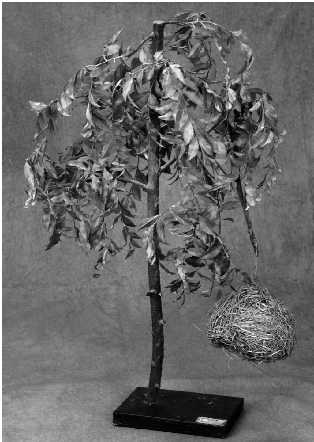
Obr. 6: Hnízdo ptáčka snovače Napoleonova, sbírky Gymnázia Kroměříž. Fotoarchív Muzea Kroměřížska.