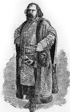
Дмитрий Александрович Агренёв-Славянский. Dmitrij Aleksandrovič Agreněv-Slavjanskij.