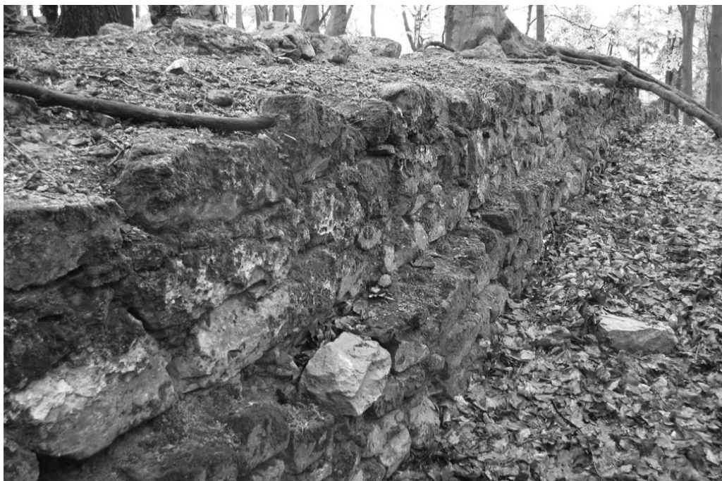
Obr. 1: Hrad Starý Světlov – dochovaný vnější líc parkánové hradby v západní části hradního jádra.

Zikmundova listina z roku 1426 je prvním dokladem o existenci skalního hradu Pulčina, který byl součástí brumovského panství a představoval opěrný mocenský bod v jeho severní části. Pulčín byl patrně zbudován až počátkem 15. století, i když archeologické nálezy nevyklučují jeho starší existenci (JANIŠ – VRLA 2018, 213–214).