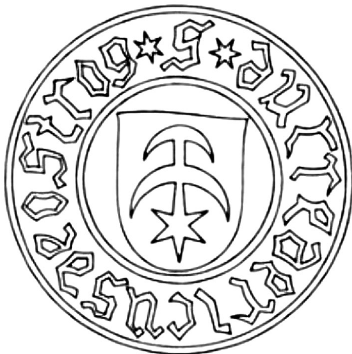
Obr. 2: Kresba pečeti knížete Fridricha Ostrožského s rodovým erbovním znamením – stříbrné půlměsíce a hvězda na červeném štítě.