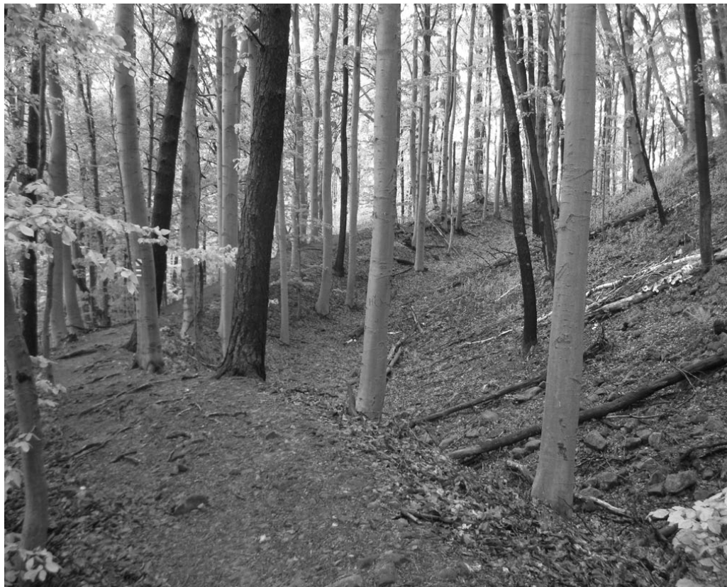
Obr. 3: Hrad Starý Světlov – východní úsek valu a příkopu kolem hradního jádra.