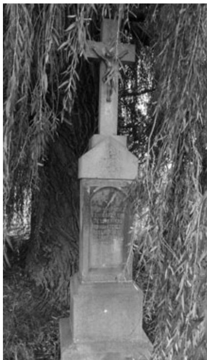
Obr. 2: Kříž z roku 1891 v Uherském Brodě při silnici k Bánovu. Foto A. Naňák, 2018.