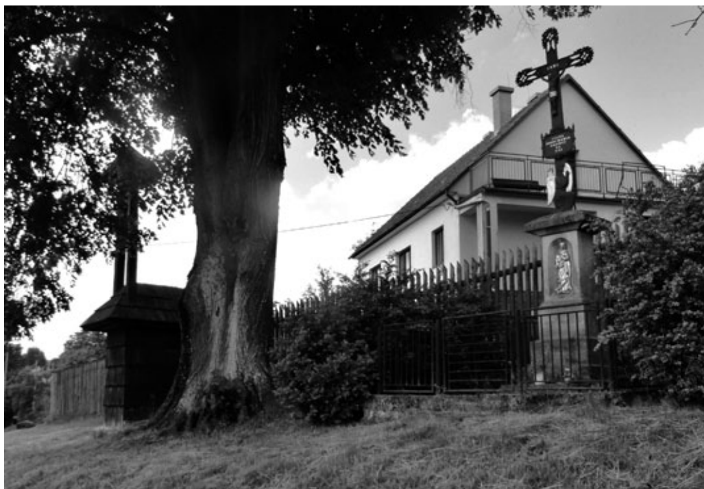
Obr. 6: Kříž z roku 1901 u zvonice na Žitkové. Foto A. Naňák, 2016. |