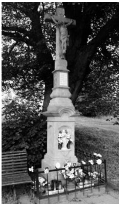
Obr. 10: Kříž z roku 1907 v Šumicích.