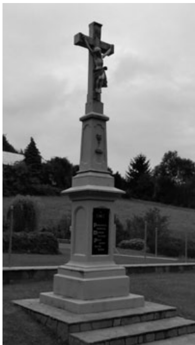
Obr. 12: Kříž z roku 1911 v Lopeníku. | Foto A. Naňák, 2016.