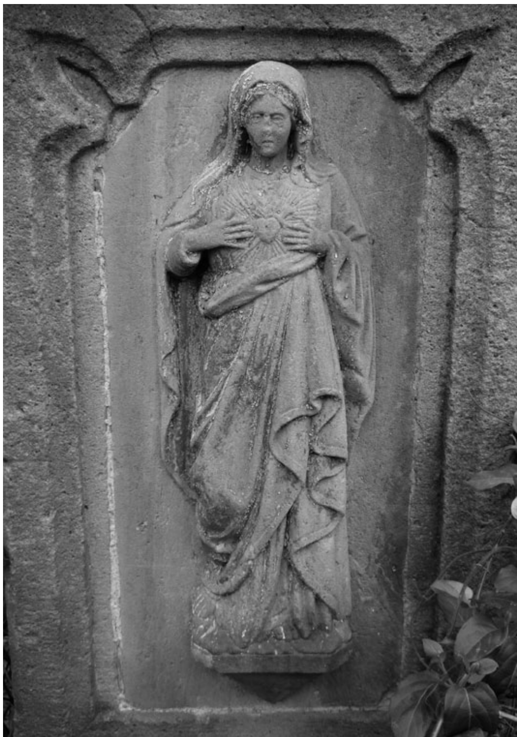
Obr. 8: Detail reliéfu na podstavci kříže z roku 1902 v Uherském Brodě v Ulici Provazní.