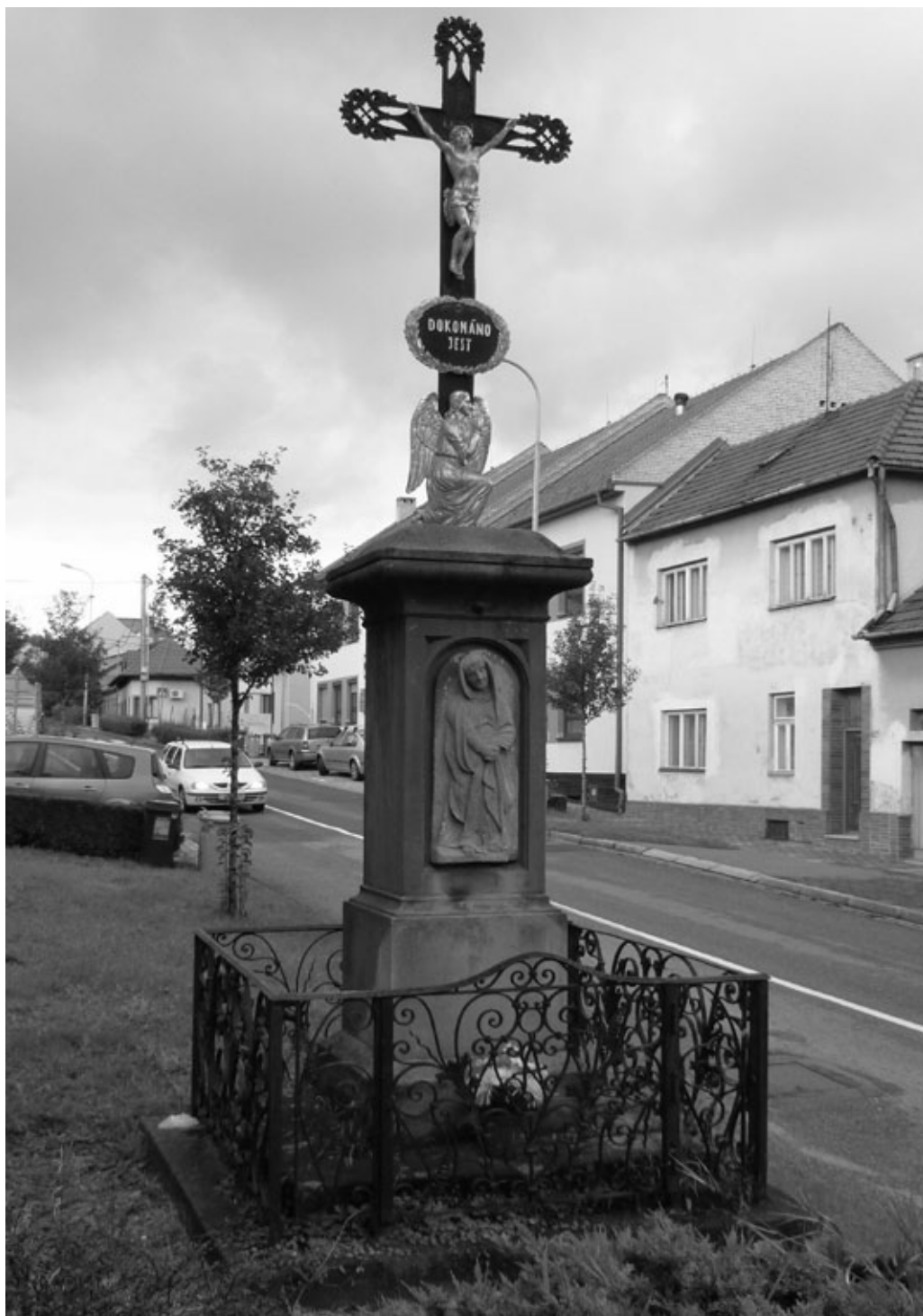
Obr. 1: Kříž z roku 1884 v Uherském Brodě v ulici Horní Valy. Foto A. Nařák, 2018. |