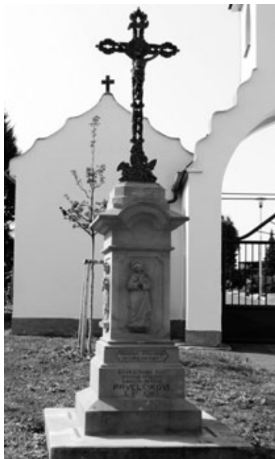
Obr. 11: Kříž z roku 1910 ve | Vlčnově. Foto A. Naňák, 2017.