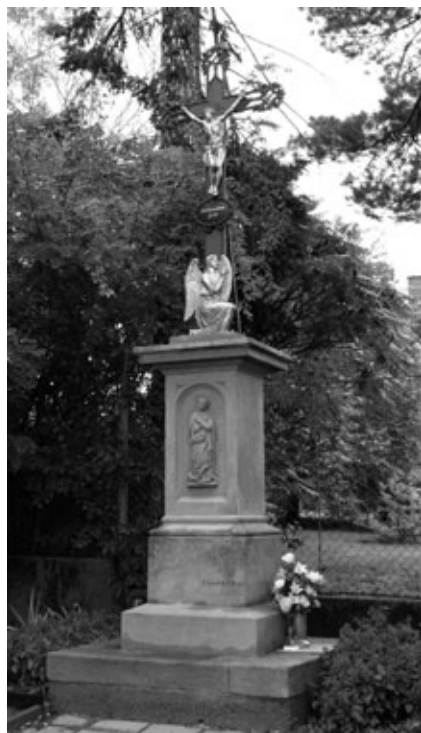
Obr. 3: Kříž z roku 1892 v Uherském Brodě v ulici Pořádková.