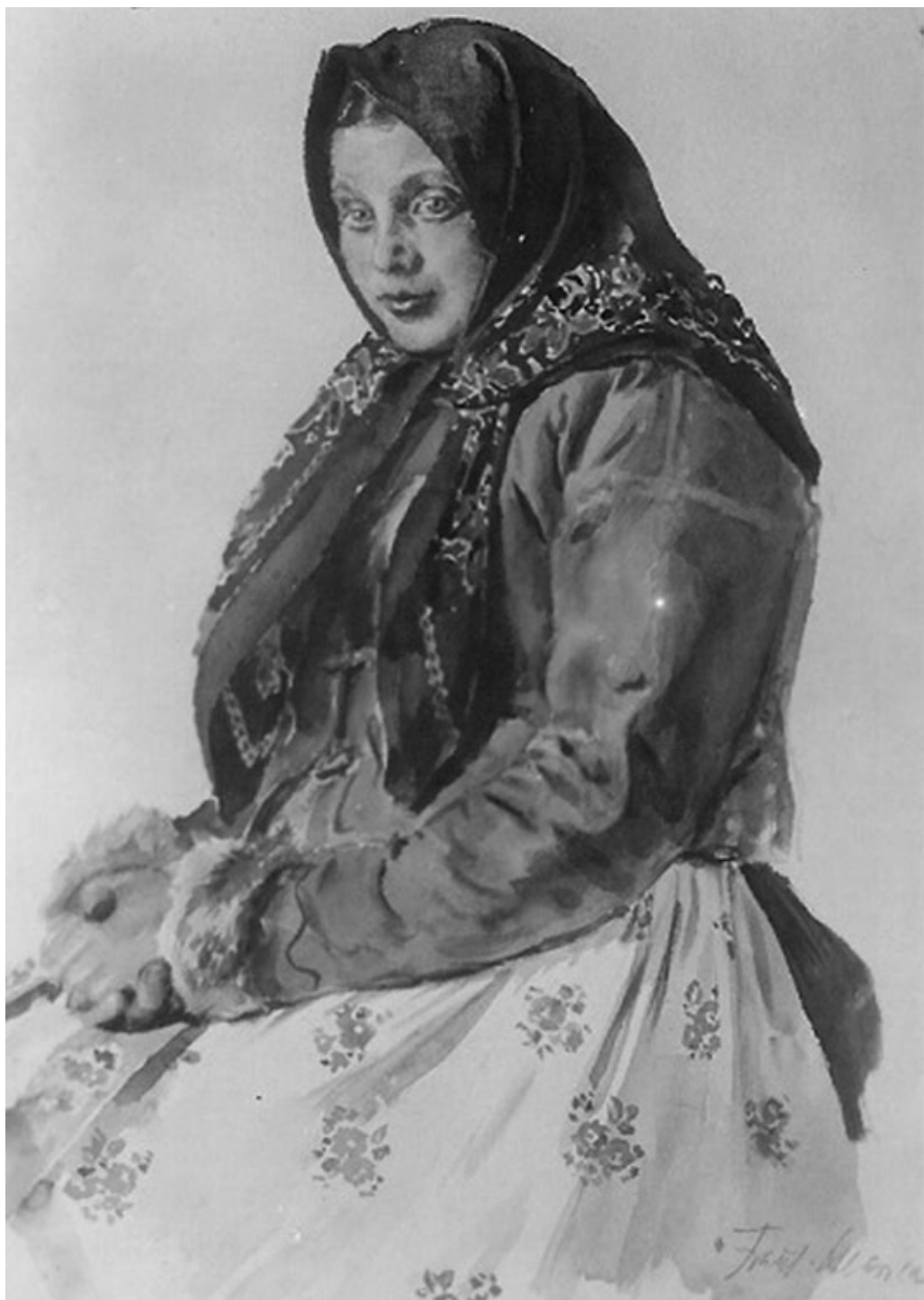
Obr. 8: František Hlavica, Starý luhačovický kroj , (1924), akvarel, Muzeum jihovýchodní Moravy ve Zlíně, foto: Nela Vičková.