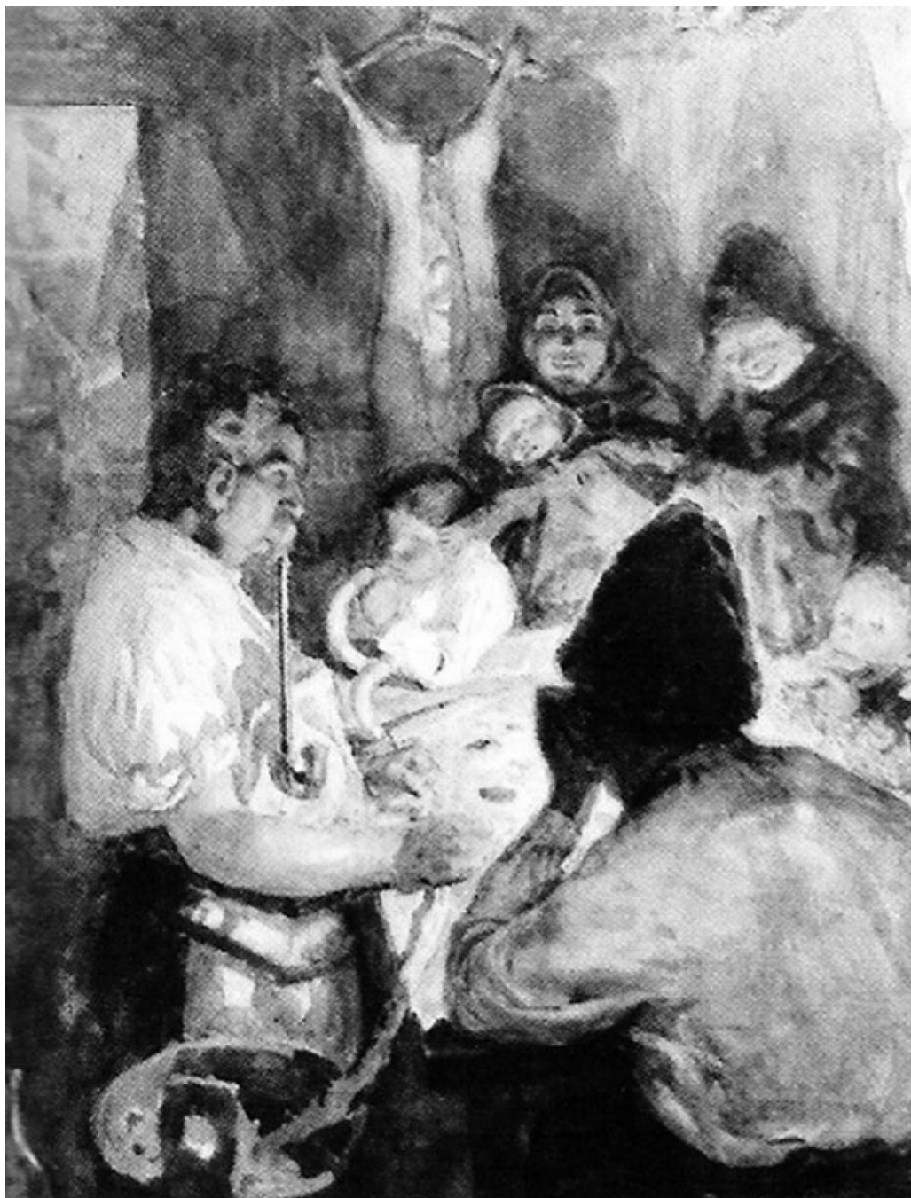
Obr. 3: František Hlavica, Zabíjačka , 1905, akvarel, tempera, MRV Vsetín, reprofoto: Nela Vičková. |