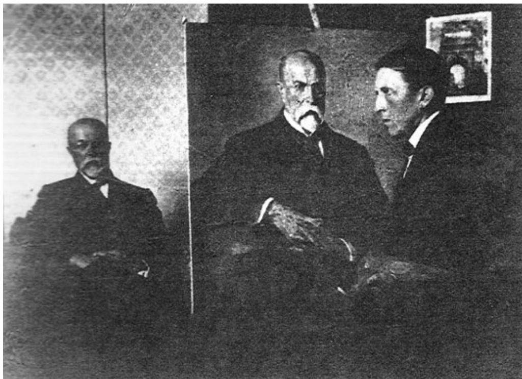
Obr. 6: Fotografie F. Hlavici při portrétování Tomáše Garrigua Masaryka, reprofoto: Nela Vičková. |

Válka tehdy zasáhla samu podstatu umění. Hlavica na rozdíl od moderních umělců, kteří pod tlakem prožitých hrůz od základu revidovali problematiku tvůrčího vztahu pomocí modernistických tendencí, nadále pokračoval v realistickém ztvárnování jevové skutečnosti. V letech první světové války se motivy díla Františka Hlavici zcela obrátily k válečným událostem. Akvarely, na nichž se objevují výbuchy granátu či oběšenci, jsou dobrým dokladem, jak vypadal život na frontě, kde se vojáci se smrtí setkávali každý den. „Když jsem byl v zákopech na frontě, modlíval jsem se, abych se dočkal nové doby. Představovali jsme si ji všichni tak krásně růžově. Kdo by se byl tehdy nadál, co na nás čeká! Ideály, ke kterým jsme toužili dospět, se nám spíše vzdalují, než by se přibližovaly. Nikde není vidět radosti ani naděje v lepší. Všechno je jaksi na scesti. Snad ještě přece se to obrátí a až bude nebezpečí největší, zvítězí rozum nad strojem.“ 20