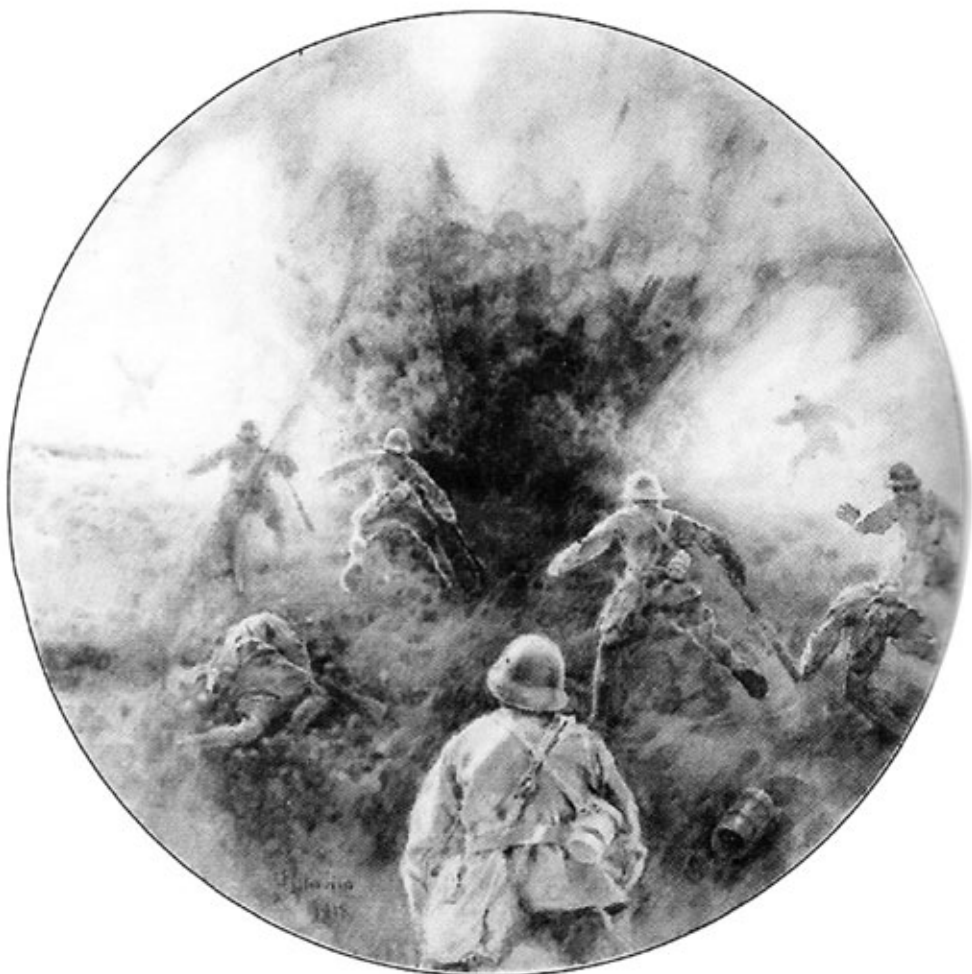
Obr. 5: František Hlavica, Výbuch granátu , 1918, akvarel, MRV Vsetín, reprofoto: Nela Vičková. |

Zatímco v první periodě bylo pro Hlavicu typické vytváření figurálních studií, ve Španělsku zaujal malíře svéráz starobylé architektury s kontrastními efekty světla a stínů, vytvořených prudkým jižním sluncem. Řada akvarelů a olejů zachycujících osobní dojmy umělce z cest tvoří významnou tvůrčí epizodu, vybočující z rámce