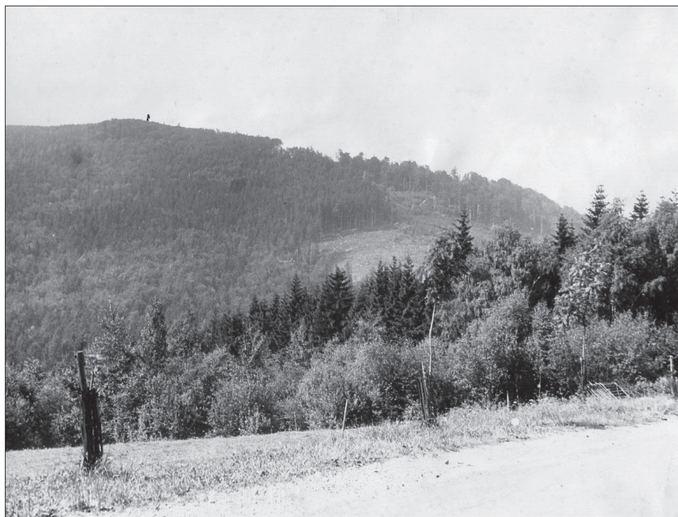
Obr. 2: Lesy v oblasti Hostýnských vrchů, kde se nacházel velkostatek Lazy-Loučka.