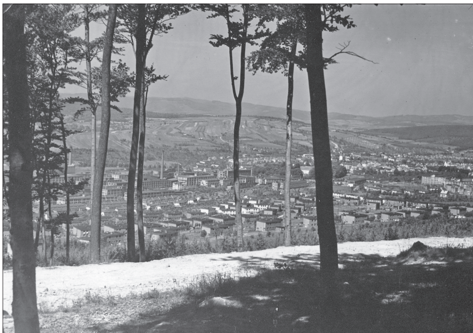
Obr. 3: Pohled z revíru Tlustá na Zlín.

Navzdory oficiálnímu rozdělení mezi více majitelů, bylo veškeré lesní hospodaření považováno za jediný celek pod jednou správou. Prvně byly jednotlivé majetky řízeny samostatně, ale po získání zlínského velkostatku došlo k zřízení Správy lesů a hospodářství firmy Baťa, a. s., č. 9100. Ta přímo obhospodařovala lesní celek Zlín-Tlustá, kam patřily revíry v okolí Zlína a Otrokovic, a nad ostatním lesním majetkem vykonávala řídicí dohled. Zároveň jí přímo podléhaly i jednotlivé hospodářské dvory na bývalých velkostatech Březolupy, Zlín a Napajedla. Vedle toho měla správa na starosti pily, sklady dřeva, ovocné i okrasné školky a agrotechnickou laboratoř s pokusným hospodářstvím.