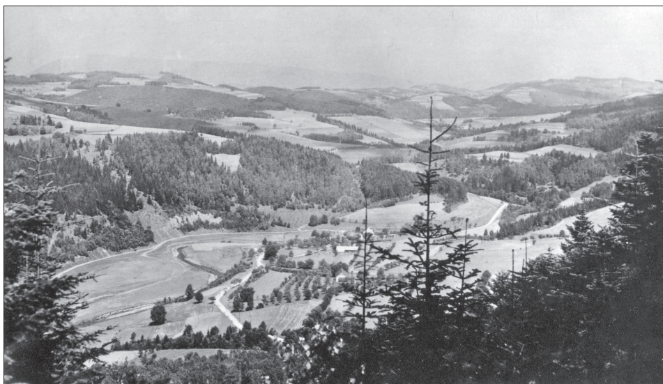
Obr. 4: Lesy v okolí Bystřičky, jež byly součástí panství Vsetín.

a habr potřebné pro výrobu kopyt a podpatků. Velké plány měl Jan Antonín Baťa s pozemky koupenými na sklonku třicátých let v Brazílii. Pro ně připravovala Správa lesů podrobný plán na jejich hospodářské využití. 12 Na místě vykácených lesů měly vyrůst nové továrny koncernu, z pokácených stromů se mimo dřeva na stavbu továrny měla získávat také tříslovina. Na kultivované půdě plánovali založit plantáže na bavlnu a kaučuk či pastviny pro skot, z něž by se mimo masa získávala i kůže na boty. Těžba měla probíhat hlavně pomocí stojů. Nízký les a křoviny měl kácet podobně jako žací stroj traktor s přidělanou strojní pilou. Na velké stromy bylo plánováno použít pily s elektrickým pohonem, který jim bude dodávat agregát. Vytěžené dřevo měly dopravovat k nově vybudovaným pilám traktory či lanovky. V podkladech vypočítávali, jaká plocha by se měla denně vyčistit a kolik dřeva by z ní přibližně vzešlo. Zde je vidět podrobné plánování a promyšlení každého detailu, které je pro firmu Baťa typické. Ale vzhledem k probíhající válce nebyly tyto lesní práce uskutečněny v plánovaném rozsahu.