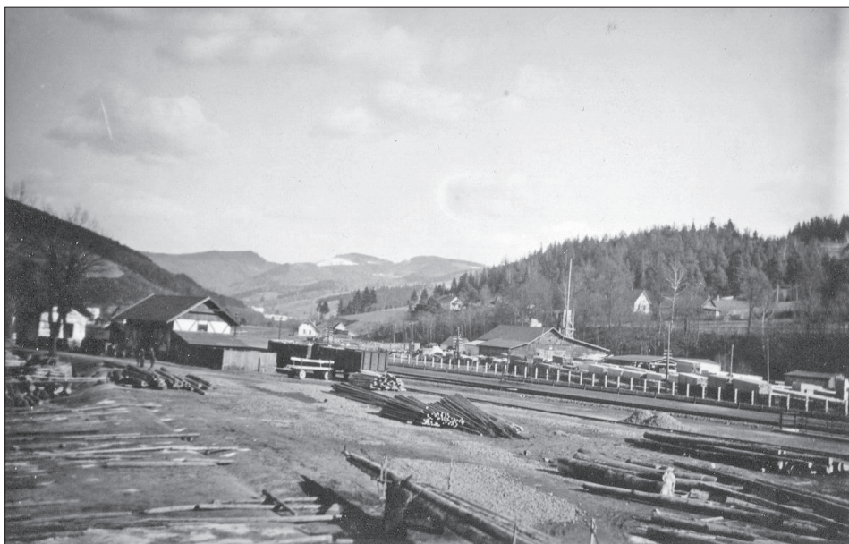
Obr. 6: Nádraží a Baťova pila v Bystřičce.