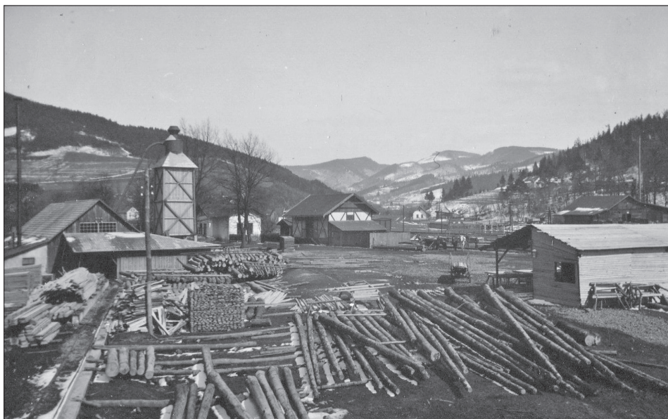
Obr. 7: Baťova pila v Bystřičce.